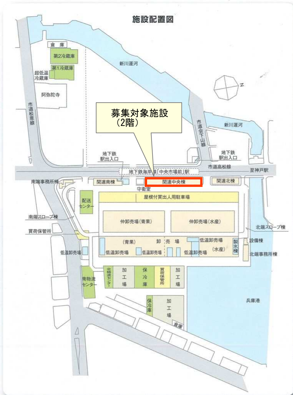
神戸市中央卸売市場位置図